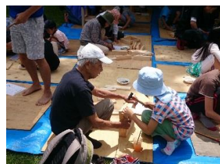
木工教室（イスづくり）

※複数の事業を行う場合は本紙をコピーの上、1事業1枚の報告書を提出して下さい。 （提出期限：令和6年2月末日まで）