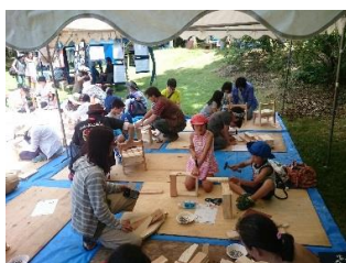
木工教室（イスづくり）