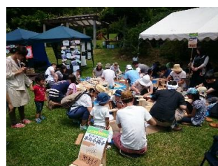
木工教室（イスづくり）