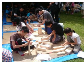
木工教室（イスづくり）