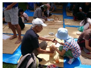
木工教室（イスづくり）

※複数の事業を行う場合は本紙をコピーの上、1事業1枚の報告書を提出して下さい。 （提出期限：令和6年2月末日まで）